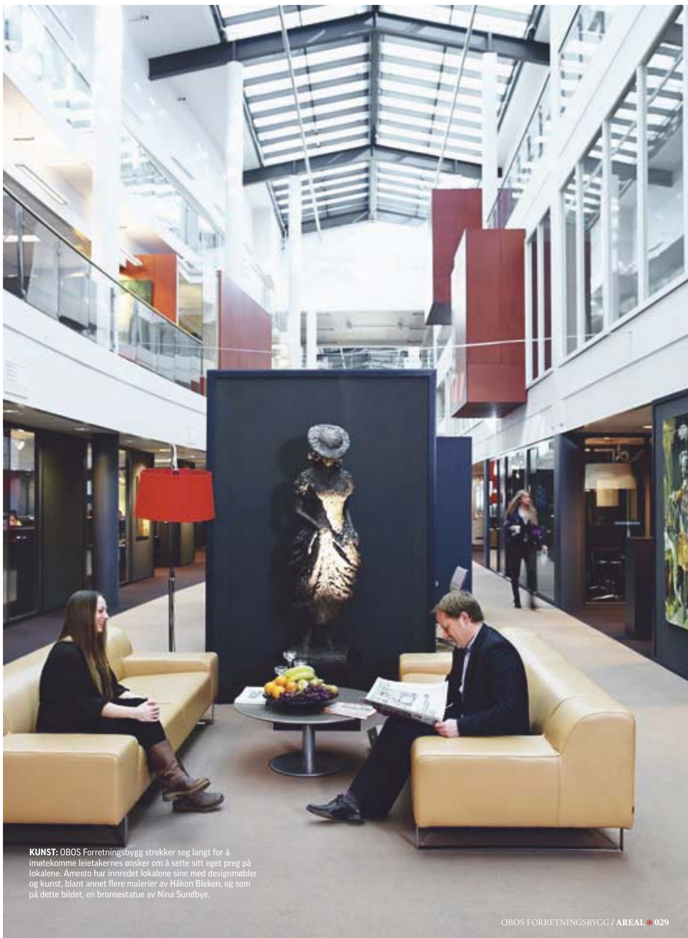
KUNST: OBOS Forretningsbygg strekker seg langt for å imøtekomme leietakernes ønsker om å sette sitt eget preg på lokalene. Amesto har innredet lokalene sine med designmøbler og kunst, blant annet flere malerier av Håkon Bleken, og som på dette bildet, en bronsestatue av Nina Sundbye.