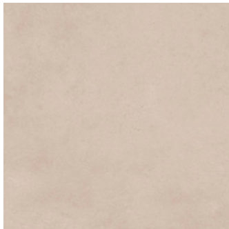
Standard Evoque, beige 60x60 gulv