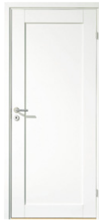
Tilvalg kr 1 300,- Unique, heltredør med ramme