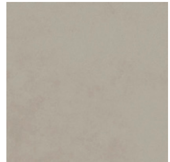
Tilvalg kr 0,- Evoque grey 60x60 gulv