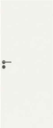
Standard Stable er en lett dør med slett overflate