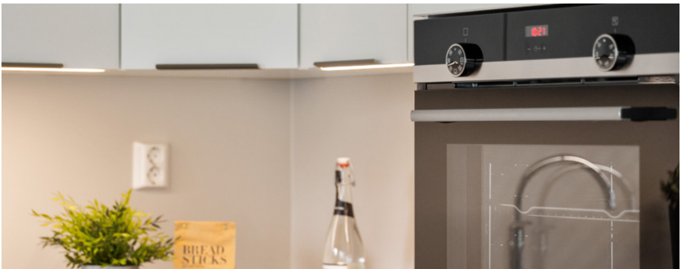
Illustrasjon av et standard kjøkken Bildet viser standard kjøkkeninnredning