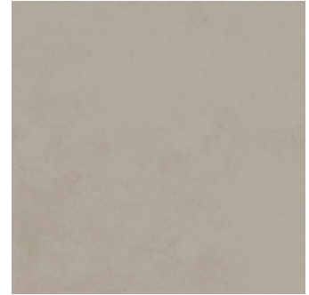
Tilvalg kr 0,- Evoque grey 60x60 gulv