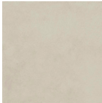
Tilvalg kr 0,- Evoque, light grey 60x60 gulv