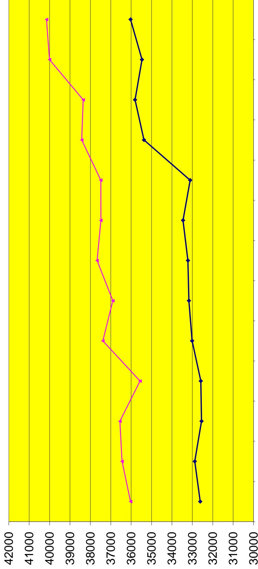
Periode 2009-2010 Siste 12 måneder