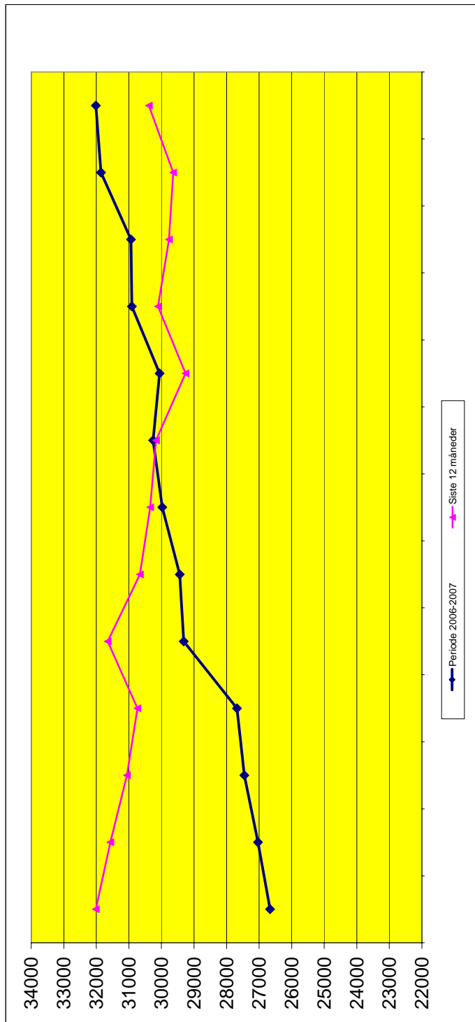
◆ Periode 2006-2007 ◆ Siste 12 måneder